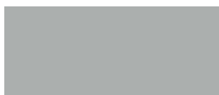
Goosewing Grey 222 NCS S3500N *