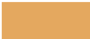
Yellow 340 NCS S2040-Y30R