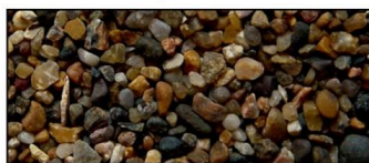
Tjæreborgsten, 1-3 mm