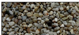
Lys T-Kvarts, 2-3 mm

De virkelige fargene kan avvike noe fra eksemplene vist over. Kontakt vår kundeservice for fargeprøver eller spesiell fargetilpasning.