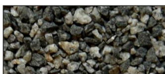
50-50 Grå og sort Granitt, 1-3 mm