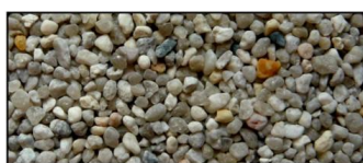
F.F-Kvarts, 2-4 mm